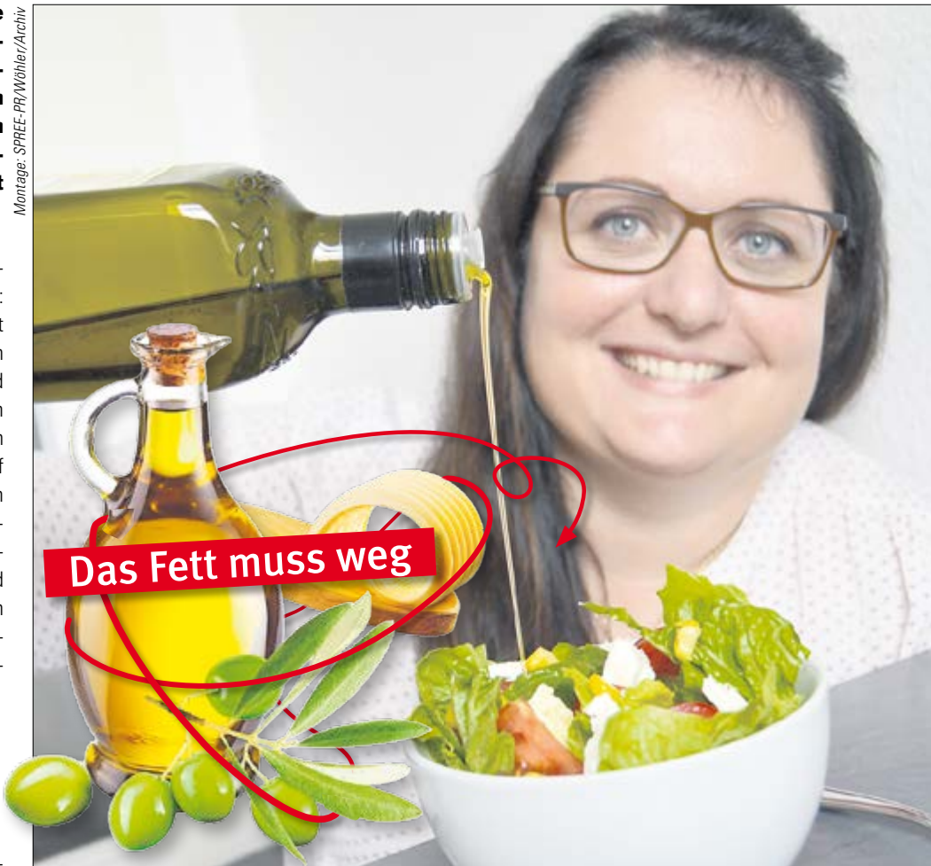
Ein aromatischer Salat braucht ein gutes Öl – doch im Abflussrohr können fettige Reste zum Problem werden.

Unter die Verordnung fallen zudem Einrichtungen, in denen eine Verpflegung stattfindet, da bei der Reinigung