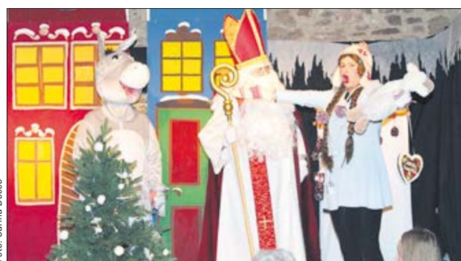
Beim Adventsfest in Behnsdorf spielt der Hauskreis auch in diesem Jahr ein kleines weihnachtliches Theaterstück.

ort Flechtingen einem jungen Brauch: dem Adventsumsingen. Nummerierte Glocken ähnlich wie die Türen des Adventskalenders weisen den Weg zum Gastgeber des jeweiligen Tages, vor dessen Haus man Weihnachtslieder singt und Glühwein trinkt. Dafür bitte eine Tasse mitbringen. Dieses Beisammensein ab 19 Uhr dauert etwa eine halbe Stunde: Eine wunderbare Möglichkeit, neue Leute kennenzulernen oder sich mit seinen die Nachbarn auf die Weihnachtszeit einzustimmen.