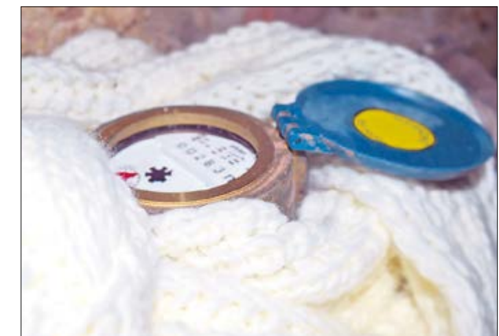
Muttis Schal sieht vielleicht hübsch aus, schützt den Zähler aber schlechter als professionelle Dämmstoffe.

Wasserzähler in ungeheizten Kellern, Schächten und Gartenläuben bedürfen im Herbst besonderer Aufmerksamkeit. Isolieren Sie Leitungen und Zähler gut – so vermeiden Sie, dass das Wasser im Zähler gefriert und das Zählerglas platzt. Bei starkem Frost sollten auch die Türen und Fenster in der Nähe geschlossen bleiben. Schäden sofort dokumentieren Sollten dennoch Frostschäden auftreten, wenden Sie sich an Ihren Meisterbereich. Dokumentieren Sie die Schäden frühzeitig, damit sich Ihre Versicherung einen Überblick verschaffen kann. Diese Dokumentation ist zudem für die Absetzung von Schmutzwasser wichtig. Denn nur Wassermengen, die nachweisbar nicht in die Kanalisation eingeleitet wurden, können bei der Berechnung von Schmutzwasser unberücksichtigt bleiben. Stellen Sie dazu einen formlosen schriftlichen Antrag. Ihr Meisterbereich bescheinigt Ihnen dann, dass das Wasser tatsächlich versickert ist. Die Heidewasser GmbH empfiehlt darüber hinaus allen Kunden mit einem Zähler im Schacht oder im Gartenhaus, den Zählerstand schon im Wege der Frostsicherung zu übermitteln. Somit wird eine Schätzung vermieden.