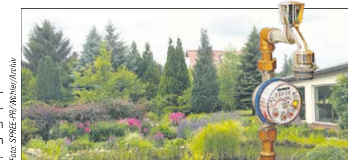
Ein Abzugszähler ist der halbe Weg zum prächtigen Garten mit Naturteich. So spart man die Gebühren für das Abwasser.

Es ist wieder soweit: Die Zeit der Zwischenzählerablesung naht. In der zweiten Dezemberhälfte versendet der AZV Aller-Ohre die Ablesekarten an alle Kunden, die über einen Zwischenzähler verfügen. Die Karten sollten gut leserlich ausgefüllt und spätestens bis zum