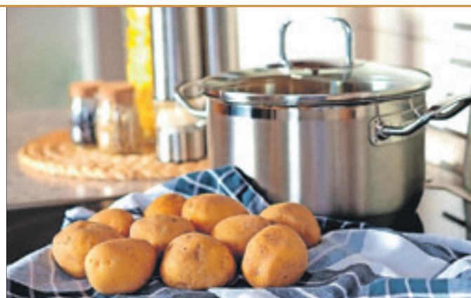
Pellkartoffeln mit allerlei Beilagen gibt's zum traditionellen Kartoffelfest in Belsdorf.

» Was? 10. Kartoffelfest, Wann? 16. September, 12–18 Uhr Wo? Gemeindesaal Belsdorf