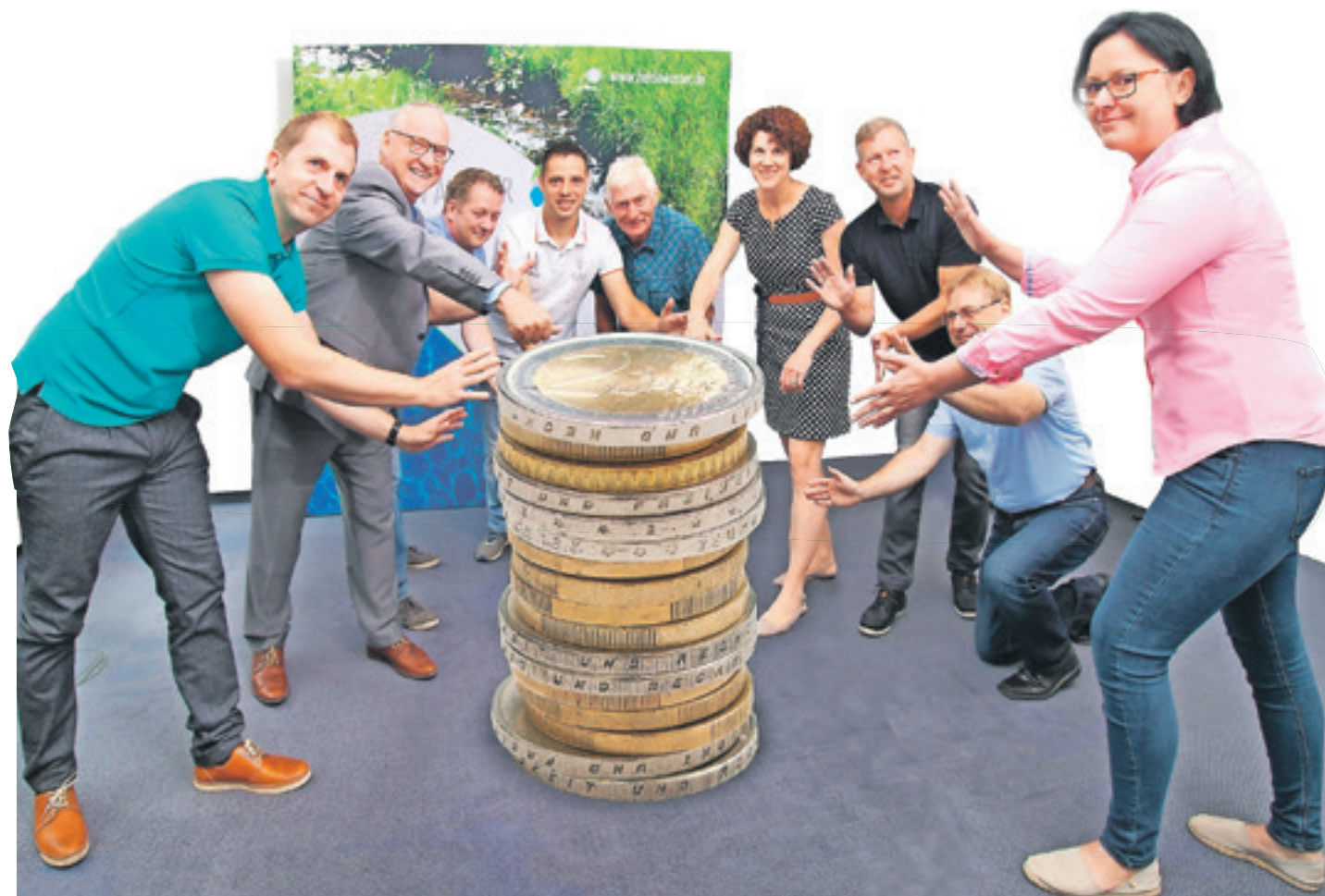
Ob Geschäftsführung, Meisterbereichsleiter oder Teamleiter in der Verwaltung, alle Mitarbeiter der Heidewasser GmbH widmen ihre Arbeit der Stabilisierung des Wasserpreises.

Um Preissteigerungen zu vermeiden, muss die Heidewasser GmbH nachhaltig kalkulieren