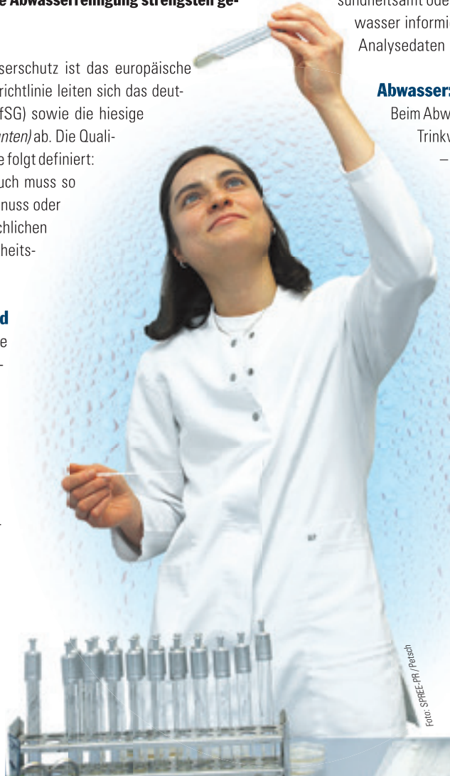
Mitarbeiter von Gesundheitsämtern nehmen Vor-Ort-Proben in Wasserwerken und Hochbehältern und werten diese in Laboren aus.

Die staatliche Überwachung ist in Sachsen-Anhalt durch das Umweltministerium im Rahmen des Wasserhaushaltsgesetzes geregelt. Zu ihr gehören technische Kontrollen der Abwasseranlagen und die Ablaufuntersuchung zur Kontrolle der wasserrechtlichen Anforderungen. Zudem werden die direkten Auswirkungen auf das Gewässer ständig kontrolliert. Zuständig für die Kontrollen sind die Obere und Untere Wasserbehörde. Im Gegensatz zu den unregelmäßigen unangekündigten staatlichen Kontrollen der Ablaufwerte findet die Eigenkontrolle der Abwasserentsorger nach der Eigenüberwachungsverordnung täglich statt. Die Mitarbeiter sind speziell dafür ausgebildet, nehmen Proben, werten diese in eigenen Laboren aus und dokumentieren die Ergebnisse für spätere staatliche Kontrollen.