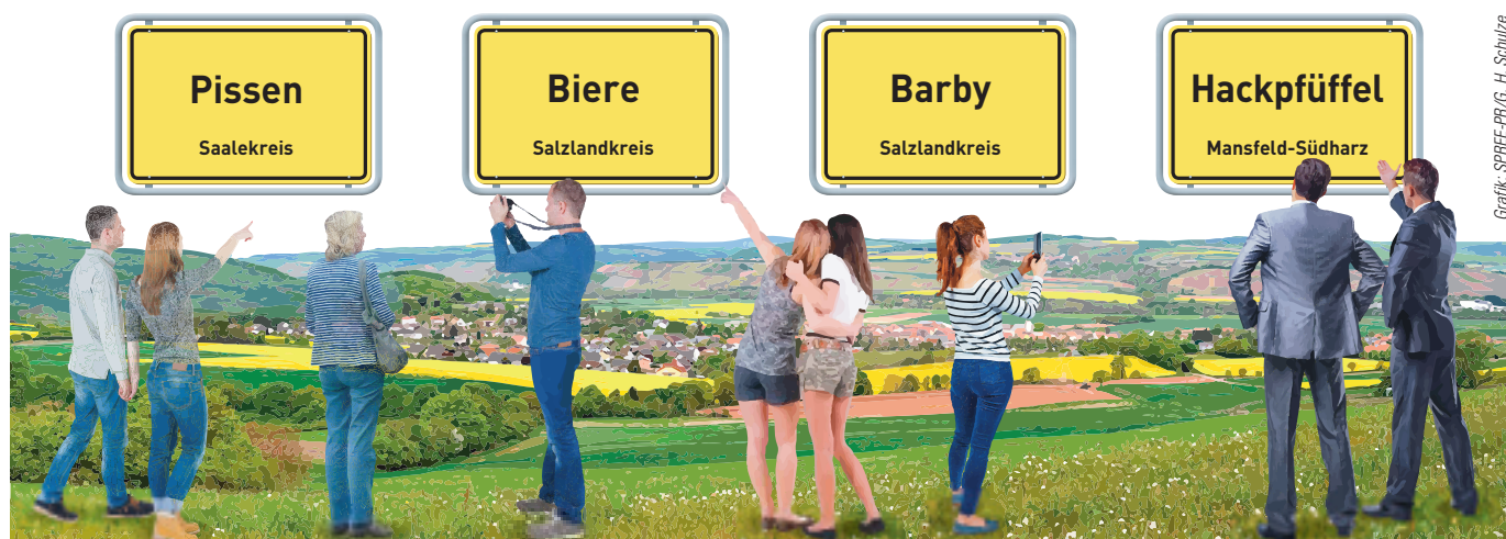
Grafik: SPREE-PP/G. H. Schulze