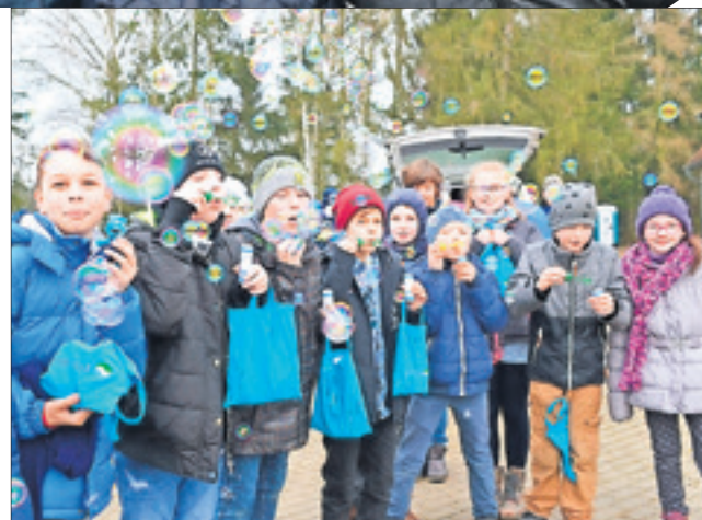
Aus der Erich-Kästner-Schule in Haldensleben reisten Kinder der dritten und vierten Klassen an, um alles über den Wasserkreislauf zu erfahren. Aus den kleinen Geschenken der Heidewasser GmbH zauberten sie einen Himmel aus Seifenblasen.