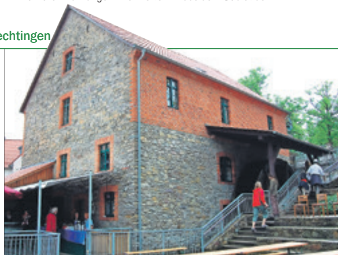
Die Schlossmühle in Flechtingen besteht schon seit 1311 als Wassermühle.

» Wann: 21. Mai 2018, 10 bis 17 Uhr www.flechtinger-heimat-und-muehlenverein.de