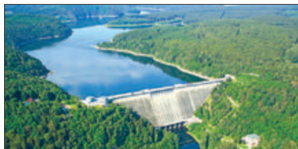
Zum Vergleich – die Rappbode-Talsperre hat ein Stauvolumen von ca. 100 Mio. m 3 .

Im Boden Sachsen-Anhalts liegen ca. 20.550 km Trinkwasserleitungen und 20.600 km Abwasserkanäle.