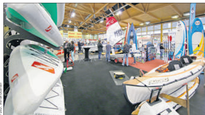
Die Wassersportmesse in Magdeburg präsentiert Wasserfahrzeuge für Aktivsportler und Freizeitkapitäne.

»Wo: Messehallen Magdeburg 9. bis 11. März, Freitag 12 Uhr bis 20 Uhr, Samstag und Sonntag 10 Uhr bis 18 Uhr www.magdeboot.de