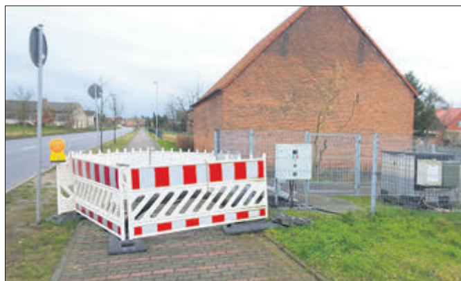
Mit dem Neubau der Pumpstation in Stegelitz verschwindet auch die Behinderung auf dem Gehweg.

Bei der jährlichen Wartung im Juli 2017 wurden massive Schäden festgestellt. Das Pumpwerk besteht aus einem drei Meter breiten und sechs Meter tiefen Schacht. Derzeit befindet sich dort ein Stahlbehälter, aus dem die Pumpen das Abwasser herausaugen und in