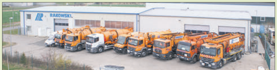
Das Unternehmen Rakowski Dienstleistungen aus Könnern wird mit seinen Fahrzeugen die dezentralen Anlagen in Gommern entleeren.