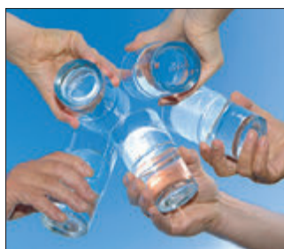
Bestes Trinkwasser für alle Europäer!

Erstes erfolgreiches Bürgerbegehren auf EU-Ebene