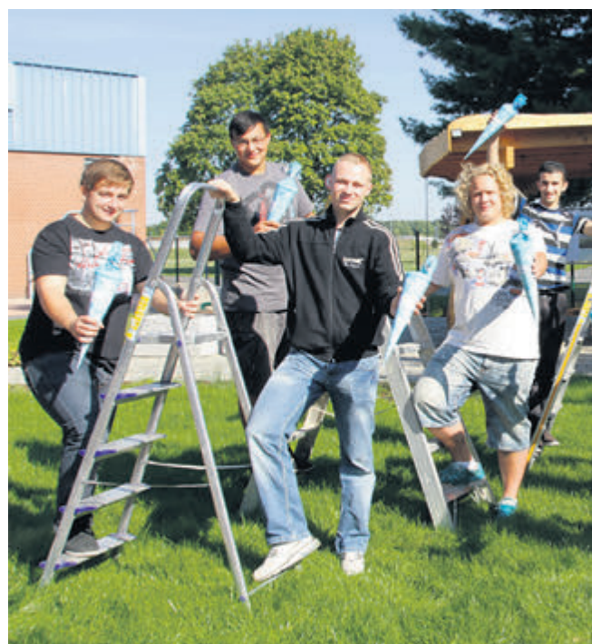
Mit dem Einstieg bei der Heidewasser GmbH erklimmen Auszubildende bereits die erste Stufe auf der Karriereleiter. Das Unternehmen will seine Mitarbeiter langfristig binden.