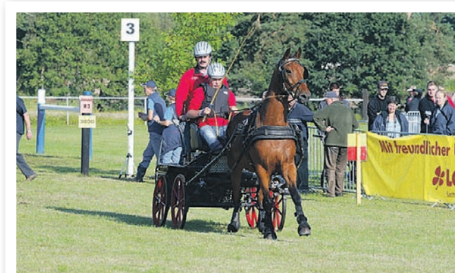
Die Bösdorfer Fahrsporttage sind ein Ereignis, das weit über die Kreisgrenzen hinaus bekannt ist. In diesem Jahr finden sie vom 24. bis 26. August statt.