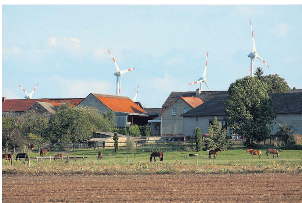
Bösdorf ist umsäumt von großen Feldern und grenzt an das Naturschutzgebiet Drömling.