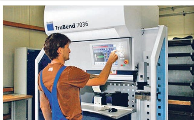
Die Mitarbeiter der Giggel GmbH in Bösdorf fertigen an hochmodernen Arbeitsplätzen hauptsächlich Teile für die Automobilindustrie aus zukunftsorientierten Materialien.