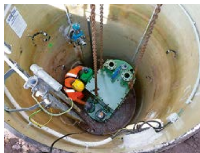
Das neue Pumpwerk ist baugleich zum bisherigen. Deshalb haben die Mitarbeiter weiterhin ausreichend Platz zum Arbeiten.

Seit 20 Jahren war sie in Betrieb, zuletzt häuften sich die Störungen, das Innenleben des Pumpwerkes – im Fachjargon als „Abwasserhebeanlage“ bezeichnet – war stark angegriffen.