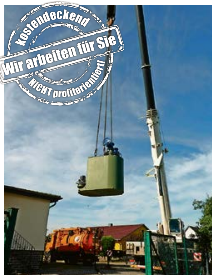
Noch einmal den Ausblick genießen, dann ging's ab in den Wedringer Schacht.

Pumpwerk in Wedringen nach 20 Jahren erneuert