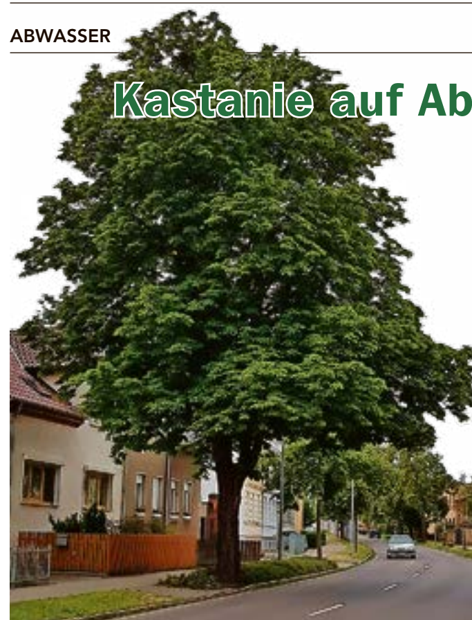
Die 90 Jahre alte Kastanie hat den Abwasserkanal angezapft. Damit ist jetzt Schluss.