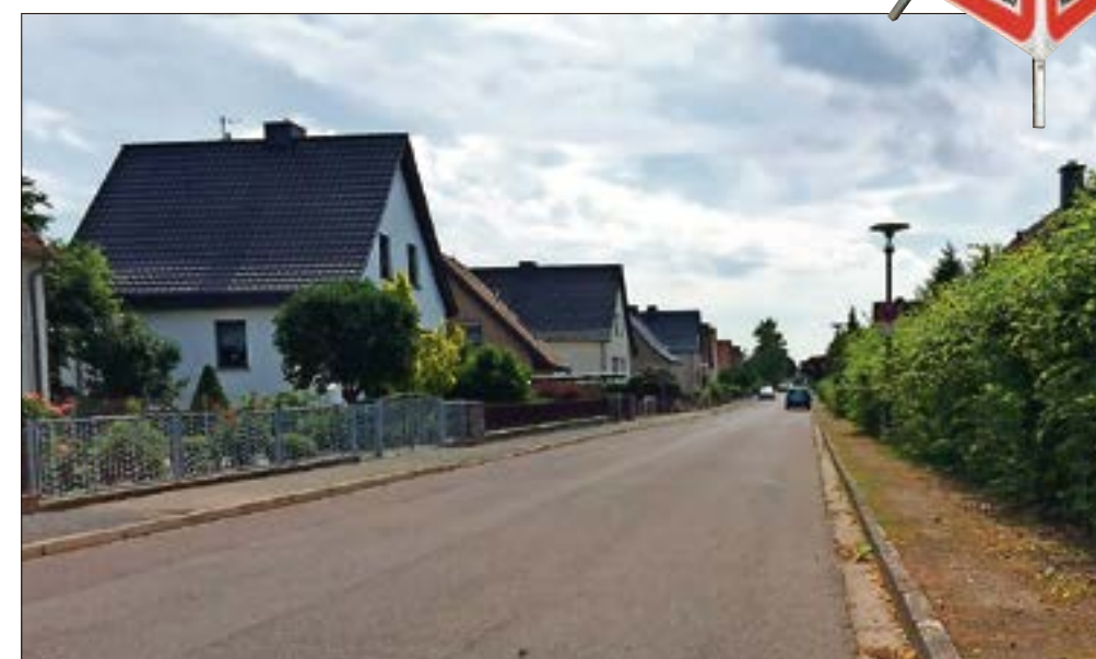
In der Warmsdorfer Straße wird der Verlauf des Abwasserkanals geändert, sodass er nicht mehr auf privaten Grundstücken verläuft.

Problem-Kanal in Haldensleben wurde umgeschlossen