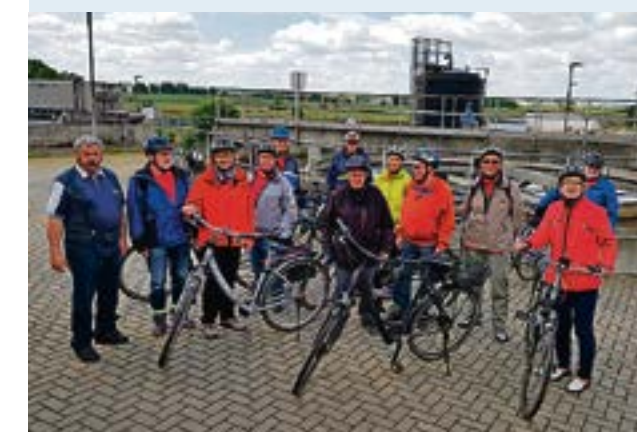
Aus Magdeburg waren die Besucher angereist.

das der Energiegewinnung dient. Beeindruckend: Die Besucher hatten bereits eine Fahrt vom Bahnhof Wolmirstedt über Farsleben, Zielitz, Colbitz und Meseberg hinter sich und radelten den kompletten Weg von Hillersleben nach Magdeburg zurück – insgesamt 42 Kilometer, und das bei einem Durchschnittsalter von 72 Jahren. Fürs „geballte Wissen und viele neue Eindrücke“ danken die rüstigen Radler anschließend herzlich.