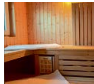
Wer hätte vermutet, dass ein Hausboot so luxuriös sein kann? Die schwimmenden Häuser am Großen Goitzschensee sind wahre Wohlfühlöasen.