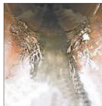
Bei einer Befahrung sind die massiven Einwurzeln sichtbar geworden.

Sie dürfte beinahe 90 Jahre alt sein, die prächtige Kastanie in der Süplinger Straße in Haldensleben. Doch ihre Wurzeln machen dem AVH und den Anwohnern das Leben schwer.