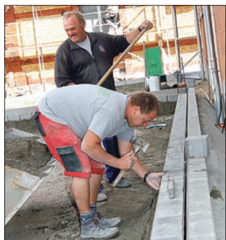
Stein um Stein entstand die Umrandung des heutigen Parkplatzes.

Seit März entstanden hier ein kombiniertes Werkstatt-, Lager- und Garagengebäude sowie überdachte