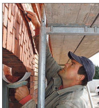
Fugen füllen am Verwaltungsgebäude, dem einstigen Maschinenhaus.

Stellflächen und Kundenparkplätze. Das denkmalgeschützte Maschinenhaus des ehemaligen Wasserwerks