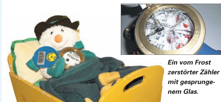
Ein vom Frost zerstörter Zähler mit gesprungene-m Glas.

So komfortabel haben es wenige Zähler. Statt des Puppenbettchens sollte der Zähler mit Isoliermaterial vor Kälte geschützt werden.