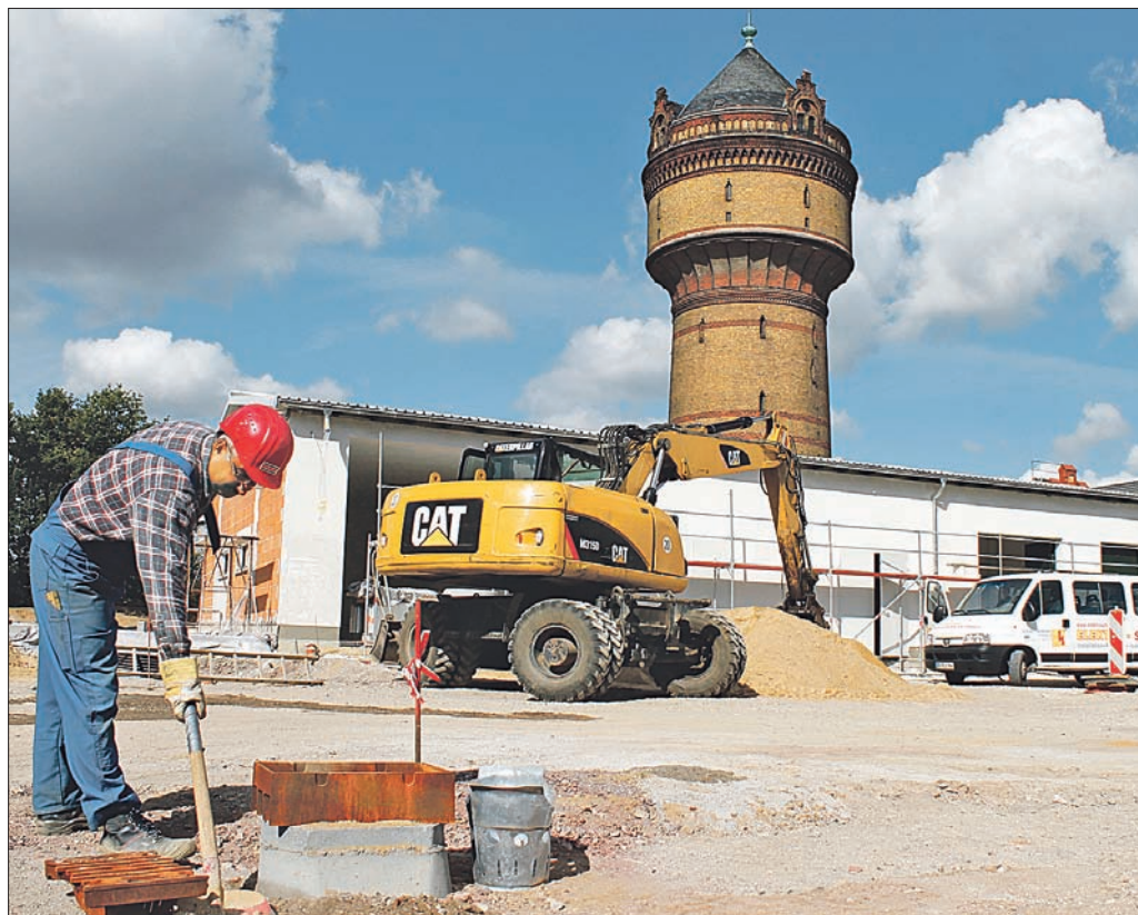
Ob mit Schaufel oder Bagger: Kleinere und größere Arbeiten am neuen Sitz des Meisterbereiches Zerbst – hier vor der künftigen Werkstatt-, Lager- und Garagenhalle – wurden in den vergangenen Wochen noch erledigt. Der 118 Jahre alte Wasserturm ist nun in guter Gesellschaft.

Stellflächen und Kundenparkplätze. Das denkmalgeschützte Maschinenhaus des ehemaligen Wasserwerks