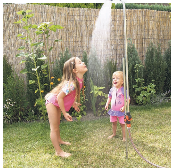
Wasserspaß im Garten: Sparen kann man aber nur, wenn das Eichdatum auf dem Unterzähler noch nicht abgelaufen ist.

Die Eichfrist für die Unterzähler der AWZ-Kunden regelt die „Satzung über die Erhebung von Schmutzwassergebühren des AWZ Elbe-Fläming“. Einen neuen Unterzähler bauen die Mitarbeiter des Heidewasser-Meisterbereiches Zerbst ein. Auch die Verplombung des Zählers übernimmt der Meisterbereich.