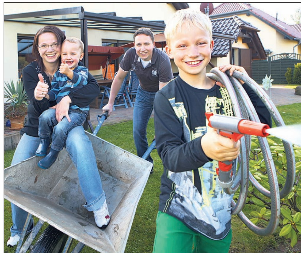
Das läuft! Heidewasser-Kunden haben gut lachen, wenn es um ihre Wasserversorgung geht.