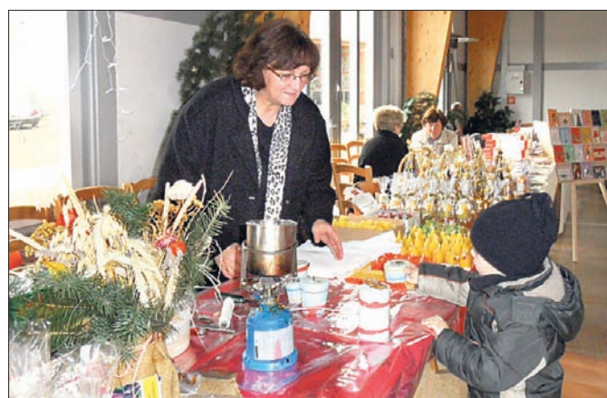
Nicht das Übliche, sondern individuelle Handwerkskunst gibt es beim Weihnachtsmarkt auf der Burg Walternienburg.

» Eintritt: frei Info: (03 92 47) 52 69 oder reifarth-wbg@web.de