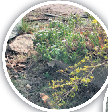
Manche Revisionsschächte verschwinden versehentlich komplett.

Die auch Revisionsschacht genannte Vorrichtung muss dauerhaft für Wartungen und mögliche Havarien frei zugänglich sein. Denn der Schacht beherbergt jene Schnittstelle, an der das Abflussrohr des Grundstückseigentümers mit dem öffentlichen Abwasserzweig verbunden ist. Für Sie wird er wichtig, wenn zum Beispiel eine Verstopfung zum Rückstau oder zu einer Überflutung in Ihrem Badezimmer führt. Dann nutzen die herbeigerufenen