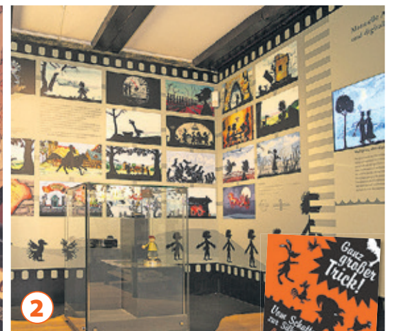
Auf der Burg Querfurt werden die großen Tricks der Silhouettenanimation erklärt.