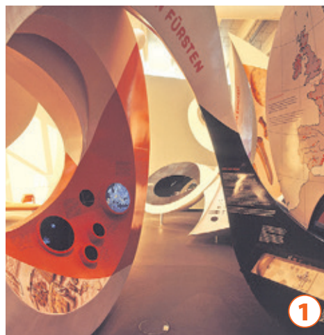
In der Arche Nebra beleuchtet die Dauerausstellung 3.600 Jahre der Astronomie und Archäologie.

→ FilmBurg Querfurt Burgring, 06268 Querfurt www.burg-querfurt.de