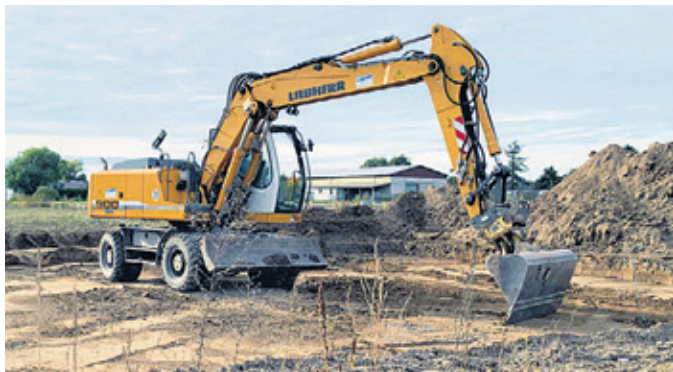
Wo ein neues Haus entsteht, müssen Trink- und Abwasseranschlüsse beantragt werden. Dies erledigen Sie bei der Heidewasser GmbH.

Weil das Telefon nur noch innerhalb fester Zeiten klingelt, schafft die studierte Fachfrau das Durchprüfen eines Antrages in 30 Minuten. Das Hin und Her zwischen einzelnen Vorgängen gehört der Vergangenheit an. „Wenn Kunden bisher anriefen,