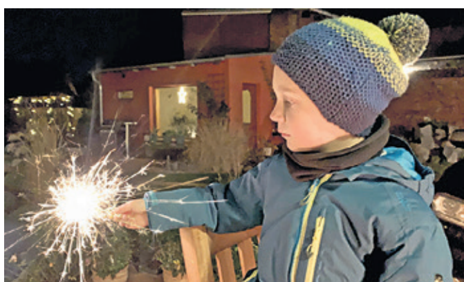
Trotz geltenden Böllerverbots ist gegen Krach mit Töpfen und Trommeln – und vielleicht einer Wunderkerze für die Kinder – nichts einzuwenden, um den bösen Geistern Beine zu machen.