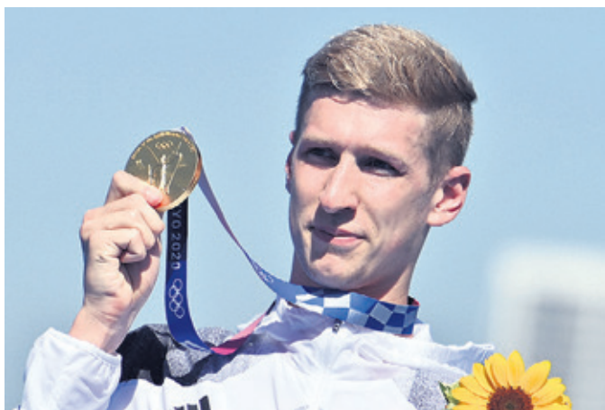
Bei den Olympischen Spielen in Tokio krönte der Schwimmer seine Laufbahn mit der Goldmedaille.