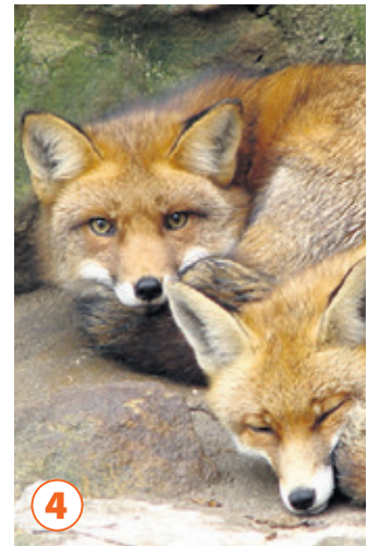
Über 200 Tiere, unter anderem diese Rotfüchse, lassen sich im Weißenfelder Tierpark bestaunen.

→ Maya Mare Am Wasserwerk 1 06132 Halle (Saale) www.mayamare.de