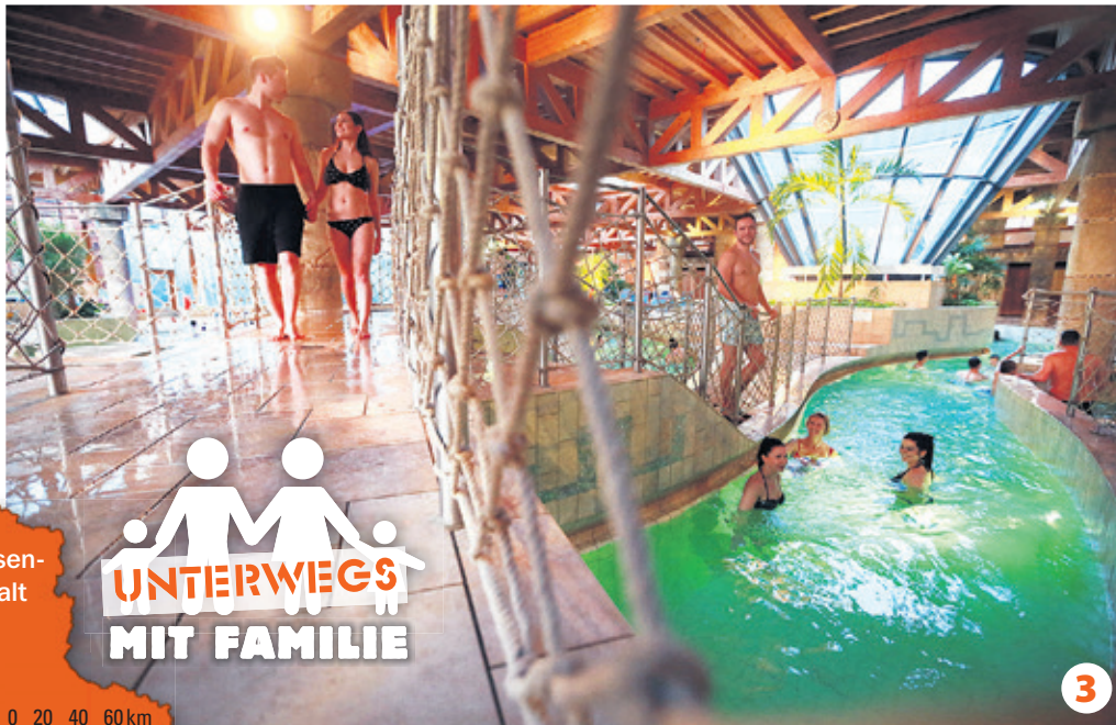
Wer sich im Winter aufwärmen, entspannen und doch aktiv sein will, ist im Maya Mare genau richtig.

→ Landesmuseum für Vorgeschichte Richard-Wagner-Straße 9 06114 Halle (Saale) www.landmuseum-vorgeschichte.de → Arche Nebra, An der Steinklöbe 16, 06642 Nebra www.himmelsscheibe-erleben.de