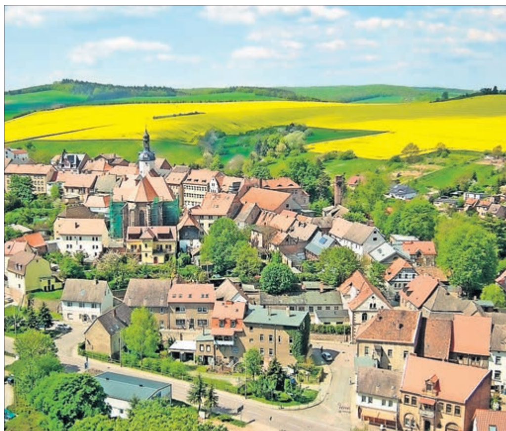
Reizvolles Mansfelder Land – Frühlings-Blick vom Turm des Schlosses Mansfeld.

Ideale Angebote für alle Sinne gibt es im Naturpark Harz/Sachsen-Anhalt (Mansfelder Land). Die Karte zeigt das Ausdehnungsgebiet.