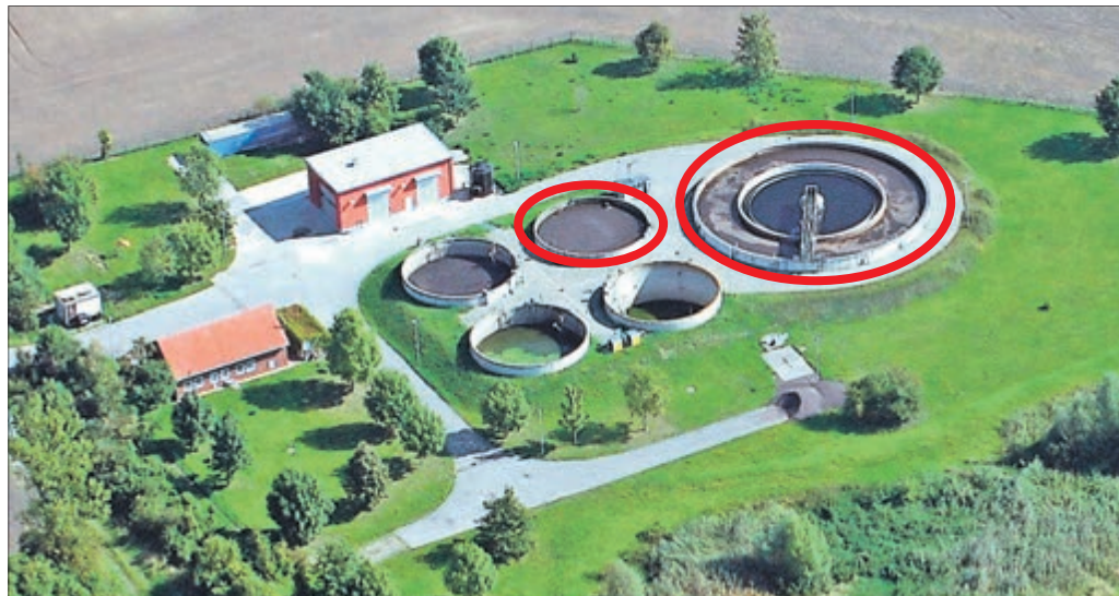
Luftbild der Loburger Kläranlage: Zu erkennen sind das kleine Bio-P-Becken und das große Belebungs- und Nachklärbecken (rot markiert). Hier verrichten Mikroorganismen Schwerstarbeit.

großen Teilen vom Phosphat befreite Abwasser anschließend gelangt, findet der Ammonium- und Nitratabbau statt. Dies geschieht ebenfalls mithilfe von Mikroorganismen, allerdings brauchen diese viel Sauerstoff. Deshalb ist ein Belüftungssystem am Boden des Beckens angebracht. Ist die Belüftung angeschaltet, bauen die Bakterien Ammonium ab, ist sie ausgeschaltet, wird Nitrat abgebaut. Nach dieser ausgiebigen „organischen Wäsche“ läuft das Abwasser in die Nachklärung (inneres Becken) und wird soweit beruhigt, dass der Schlamm sich auf den trichterartigen Boden absetzt. Dieser wird dann in das Bio-P-Becken zurückgepumpt. Das klare Wasser wird in die Ehle eingeleitet.